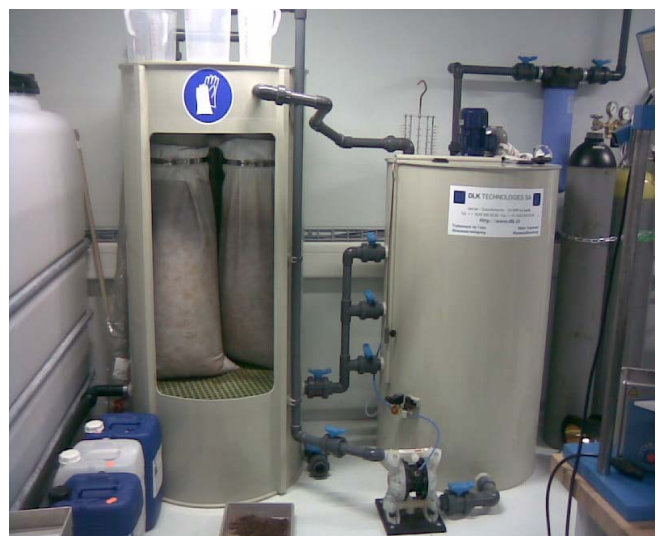
Réacteur de 500 litres avec 1 x 2 poches.

La séparation des boues s'effectue à l'aide de poches filtrantes, d'un filtre presse ou d'un décanteur centrifuge pour les grands volumes.