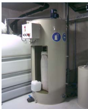
Réacteur semi-automatique de 200 litres avec poche