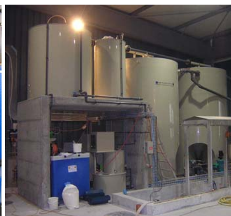
Installation en ligne capacité 5 m 3 /h, avec 2 décanteurs verticaux en parallèle