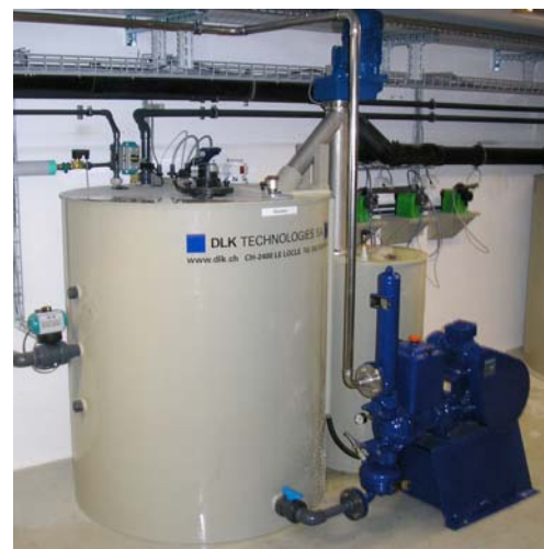
Réacteur de 1'000 litres avec filtre presse