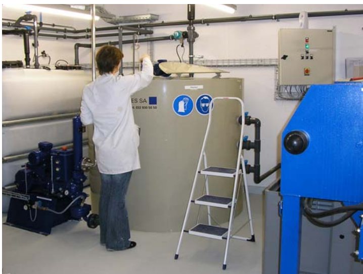
SPA 11 2'000 avec cuve de sécurité de 2 m 3 , 1 réacteur de 2'000 litres et filtre presse.