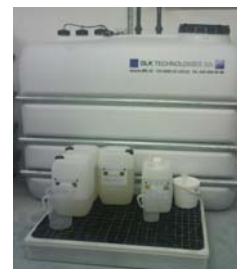
Stockage de 4 m 3 Palette de rétention avec réactifs