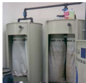
2 jeux de 2 poches