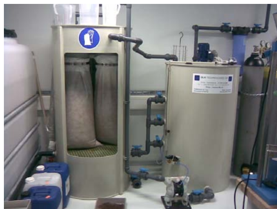
SPA 11 500 avec cuve de stockage de 1'500 litres, 1 réacteur de 500 litres et 1 jeu de 2 poches.